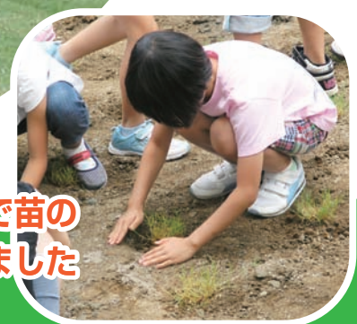
自分たちの手で苗の 植え付けもしました