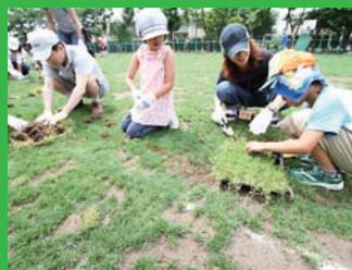
多くの児童が植え付けに参加。2ヶ月後には一面に緑が広がった。

日常の芝生の手入れは、桃五小芝生を育てる会とPTAの芝生委員がとりまとめ役となって、各クラスの芝生係や保護者、地域の方々に呼びかけを行っています。一人でも多くの人に芝生の校庭に関心をもってほしいとの思いから、日常の手入れ作業をイベント化したり、スタンプラリーやお茶会(野点)を行うなど、参加して楽しめる工夫をしてきました。利用頻度の高い芝生ですが、大勢の人の協力により芝生を維持しています。