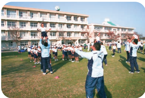
芝生化校でのスポーツプログラム

このスポーツプログラムを通じて、タグラグビーなどが学校に導入されるようになりました。