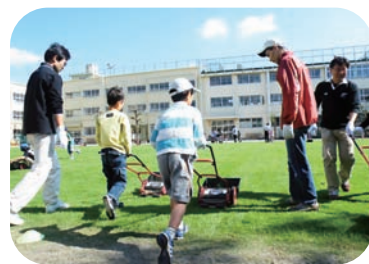
児童との芝刈りの様子