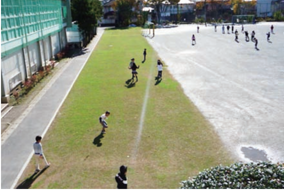
校庭周縁部芝生化(540㎡)

冬芝のオーバーシードを行っているが主体は夏芝。 広くないため3人でも管理できている。