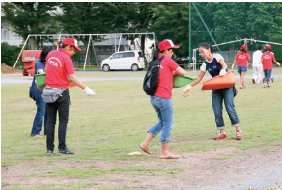
トラック部以外ほぼ全面芝生化(2,142㎡)

10月は「3年生の保護者」の当番月。 PTA役員はおそろいのユニフォームで参加。