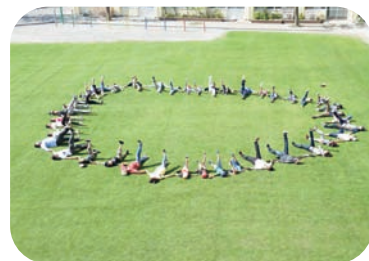
参加者全員での記念撮影

東京都では、応援団参加団体が学校関係者の皆さんとの交流を深め、芝生の良さを実感しながら各学校の維持管理作業を支援する機会を今後も提供していきます。