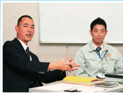
磐田市生活文化部スポーツ振興課 矢部課長補佐(左) 柴田副主任(右)