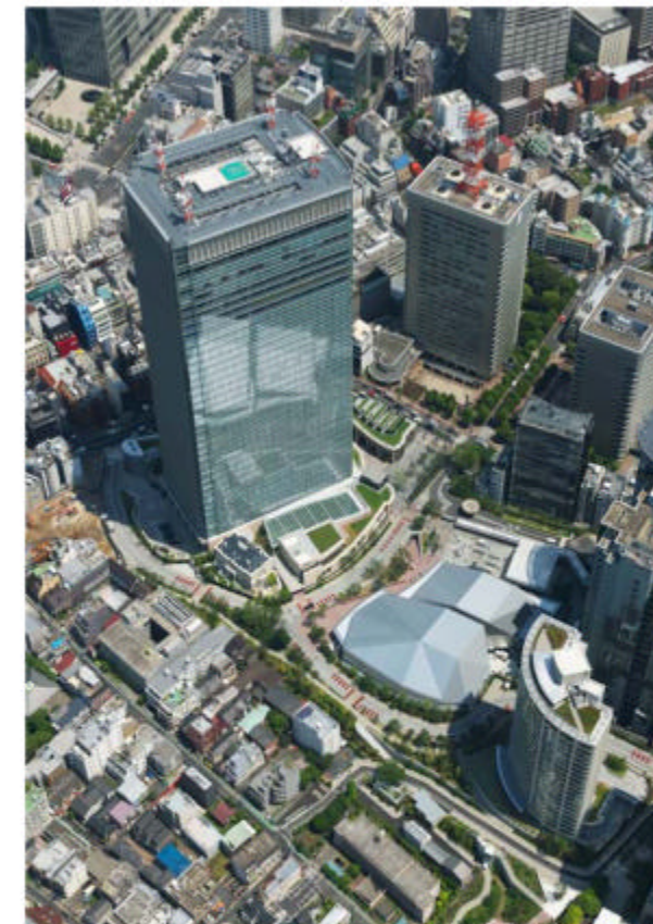
敷地北側からの空撮

株式会社東京放送ホールディングス 三井不動産株式会社 株式会社久米設計 TBS開発建設工事共同企業体 代表会社 株式会社大林組