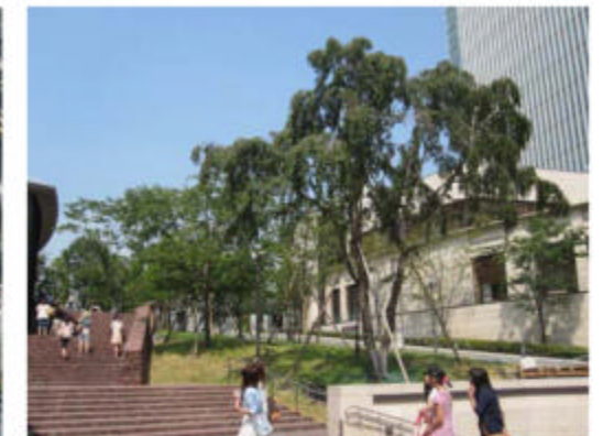
さかみち広場のシダレザクラ