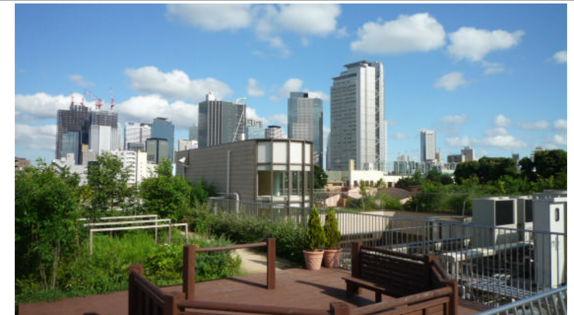
屋上北部より全体を望む