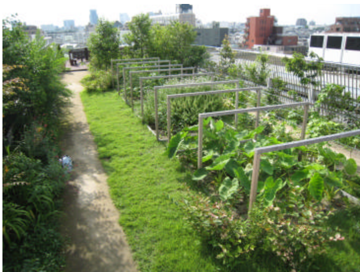
実践農園 生徒の管理する農園は豊作となっている