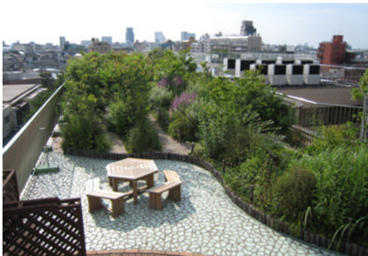
実践の森 屋上でありながらもその様子はまさに森のよう